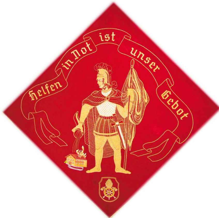
Neue Fahne der Feuerwehr, angeschafft zum 100-jährigen Gründungsfest.